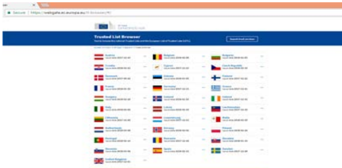
Fig. 1 Trusted List (Listă de încredere) la nivel UE

1. Se accesează următorul link: https://webgate.ec.europa.eu/tl-browser/# . Se va deschide în browser pagina din Fig.1. Se va selecta țara din care provine prestatorul de servicii de încredere calificate. (țara și prestatorul se găsesc în eticheta certificatului semnăturii care s-a folosit la semnarea documentului). În acest ghid s-a luat ca exemplu România. Se procedează analog pentru celelalte state membre UE.